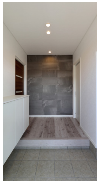
正面タイルをアクセントにした玄関ホール。