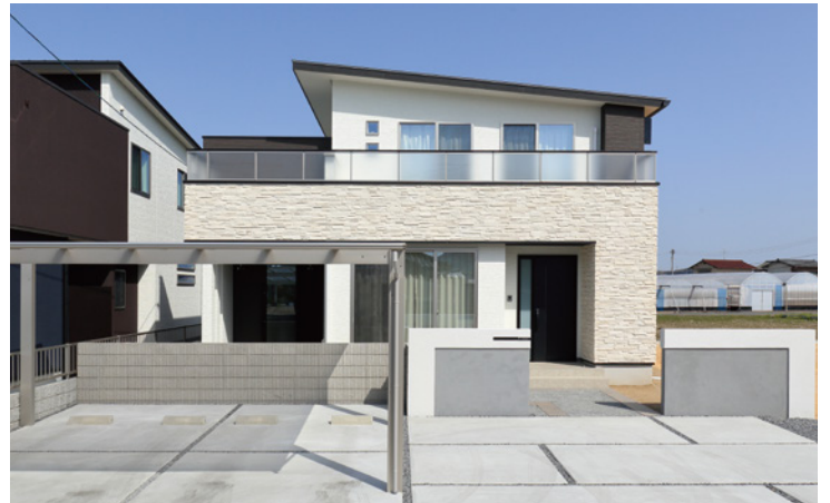
L型に張られた外壁タイルとバルコニーのスクリーンが存在感と高級感を放つモダンな外観。