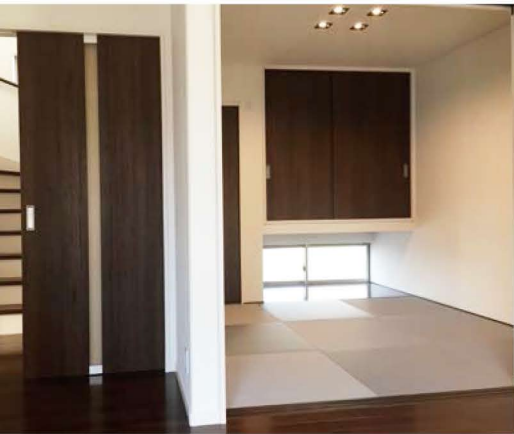
玄関ホールから出入りできる、客間として使用可能な和室。