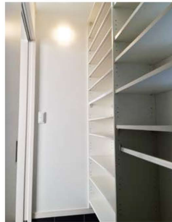
大容量の土間収納を完備した玄関。