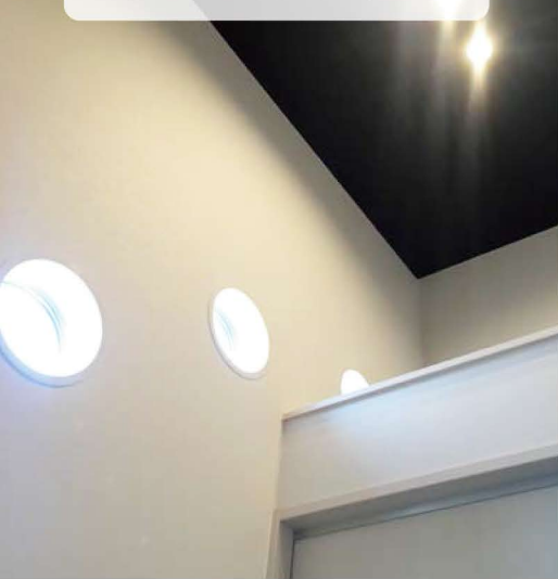
ウォルナットの吹抜け天井がシックで開放感のある玄関ホールを演出。