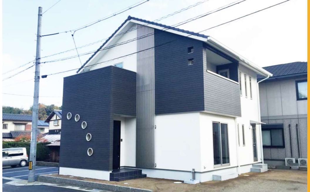
円弧状に並んだ丸窓とシルバーのアルミ縦格子がアクセントとなったシンプルモダンな外観。