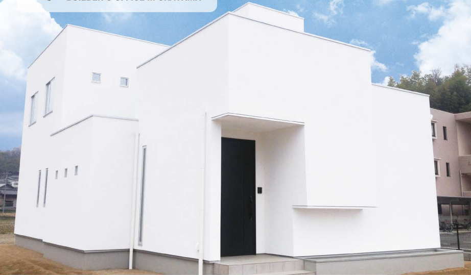
白色が一際目立つ、デザイン性の高いシンプルモダン住宅。