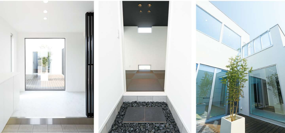
正面に見える中庭が印象的なエントランス。