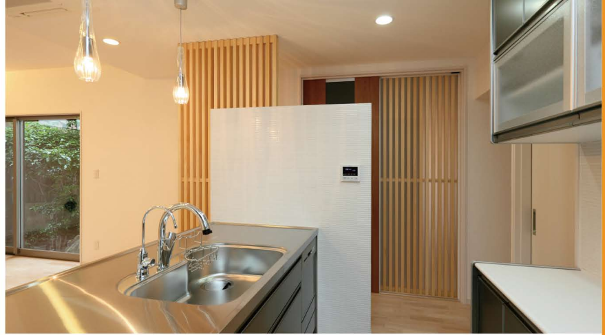
高低差を持つカウンター横壁と格子をスライドさせ、キッチンに躍動感を。