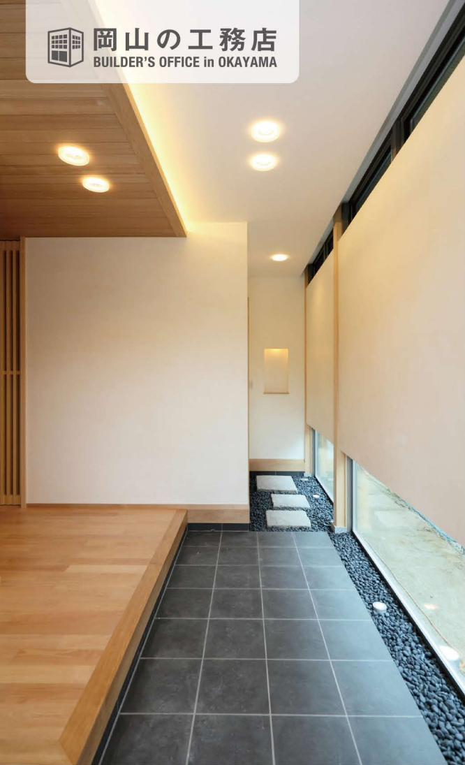
立地的な壁面構成と素材の使い分けで、開放的な空間に「和」の落ち着きをプラス。