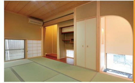
和室はアーチ壁を設けて茶室風のただずまいに。